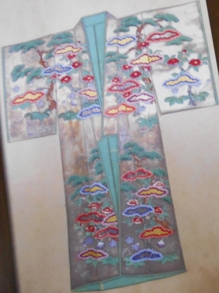
『男女装束図』江戸時代 採女絵衣