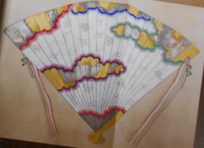
『男女装束図』江戸時代 梅扇